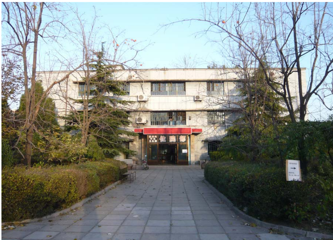
La sede del 1° Centro di salute mentale italo-trentino-cinese nel Distretto di Haidien Apertura prevista giugno 2009