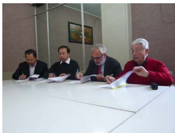
Firma degli accordi di collaborazione tra la parte cinese e la parte italiana Pechino, 7 novembre 2009